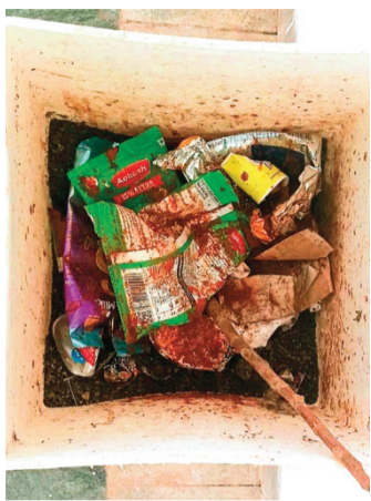
हरिभूमि न्यूज अशोकनगर